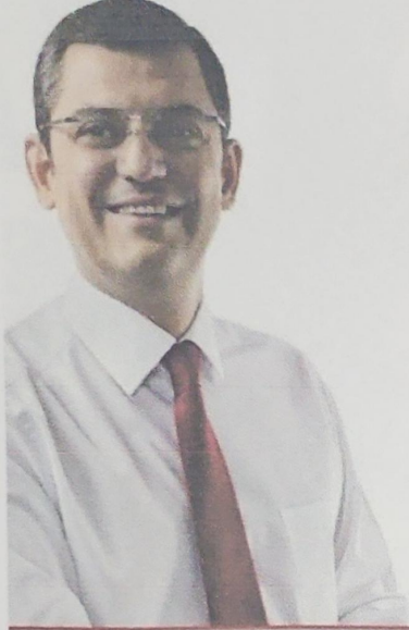
ÖZGÜR ÖZEL CHP GRUP BAŞKANVEKİLİ MANİSA MİLLETVEKİLİ

Türkiye Tanıtım Araştırma Demokrasi ve Laik Oluşum Vakfı